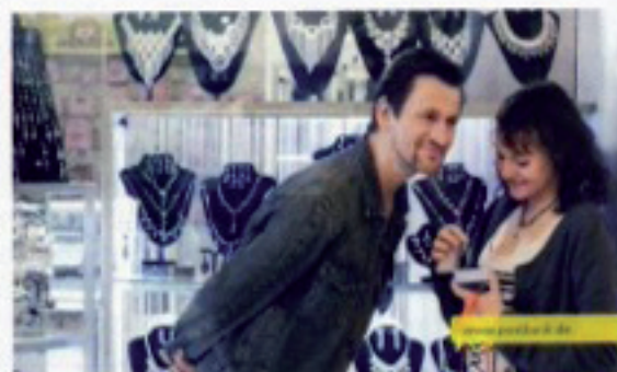
6 Postbank | 2,42 BBDO Proximity, Düsseldorf