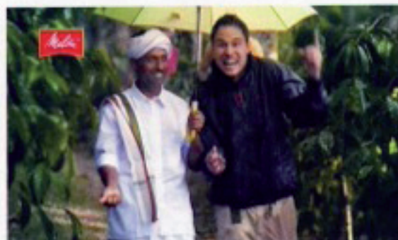
3 Melitta Bella Crema | 2,49 BBDO Proximity, Düsseldorf