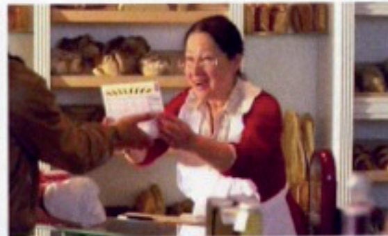
5 Merci | 2,48 Pahne Markenmacherei, Hamburg