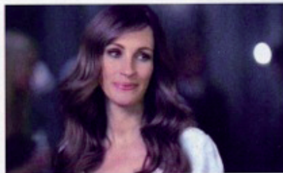
3 Lancôme La vie est belle | 2,49 Publicis Worldwide, Paris