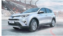
Toyota Aus Mut werden Legenden