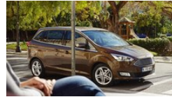
Ford Praktisch und elegant - Ford Grand C-MAX