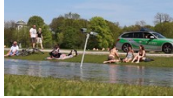
Provokante Aktionen Was sollen die Überwachungskameras in der Isar?