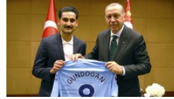
Özil und Gündoğan Typisch deutsche Fußballprofis