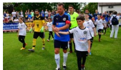
Abschiedsspiel von Lothar Matthäus A weng brudal