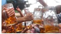
Oktoberfest Wiesn-Bierpreis: Die saftigste Erhöhung seit Jahrzehnten