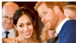
Hochzeit von Prinz Harry und Meghan Markle Daddy Fool