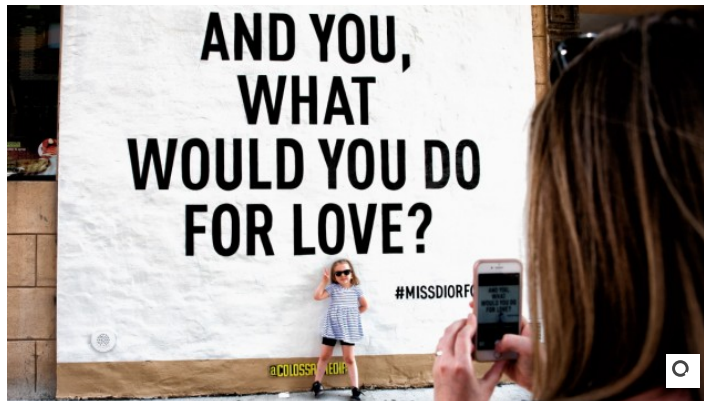
Macht alle mit: von Dior gestaltete Werbewand, als solche erst auf den zweiten Blick erkennbar.

Modemarken sprühen lassen Street-Art-Künstler seit einiger Zeit Häuserwände besprühen.