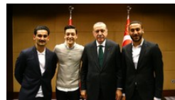
Fußballer Gündoğan verteidigt Treffen mit Erdoğan